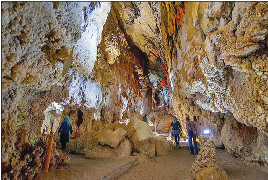
غار چال نخجیر، دلیجان