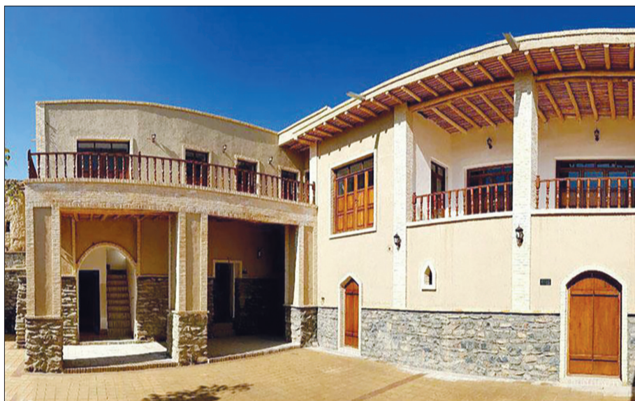
منزل تاریخی میرزا تقی خان امیرکبیر، روستای هزاوه از توابع شهرستان اراک