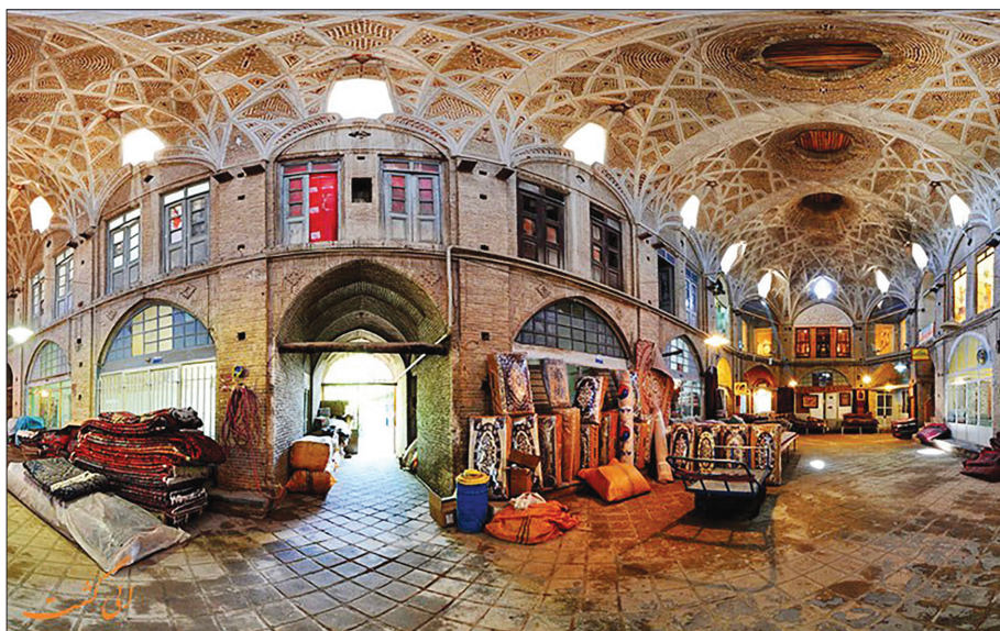
بازار تاریخی اراک