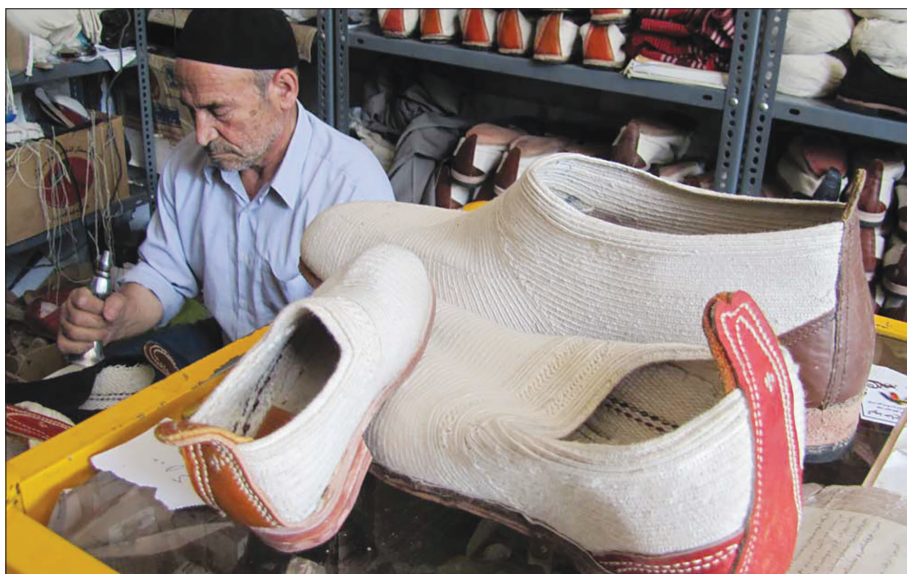
دوخت گیوه سنجان از صنایع دستی برتر استان مرکزی، سنجان