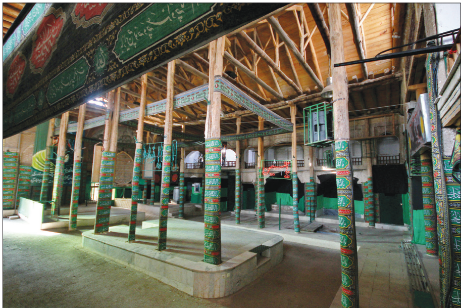
مسجد و تکیه شش ناوشهر