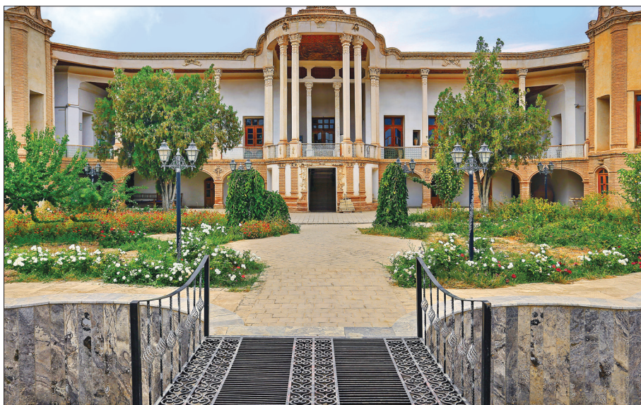
قلعه سالار محتشم، خمین